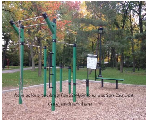
Voilà ce que l'on retrouve dans un Parc à St-Hyacinthe, sur la rue Sacré-Coeur Ouest. C'est un exemple parmi d'autres.

Ce Parcours Santé Desjardins pourrait être composé de différentes stations qui proposent différents exercices à faire avec des panneaux explicatifs. Ce serait comme un petit gym extérieur.